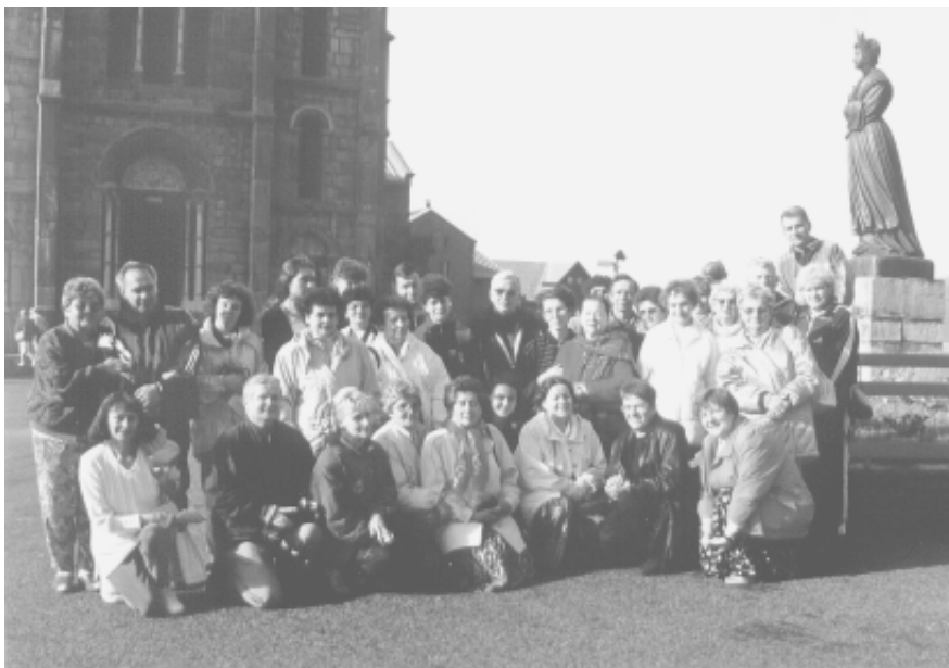
Wspólne zdjęcie zrobione w La Salette wczesnym rankiem 5 września 1998 roku

Grupa jest otwarta dla wszystkich, którzy chcieliby znaleźć w niej swoje miejsce. Grupa otrzymała w użytkowanie tablicę (gablotę) informacyjną w kruchcie kościoła.